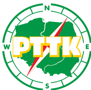
Fot. 4. Logo PTTK